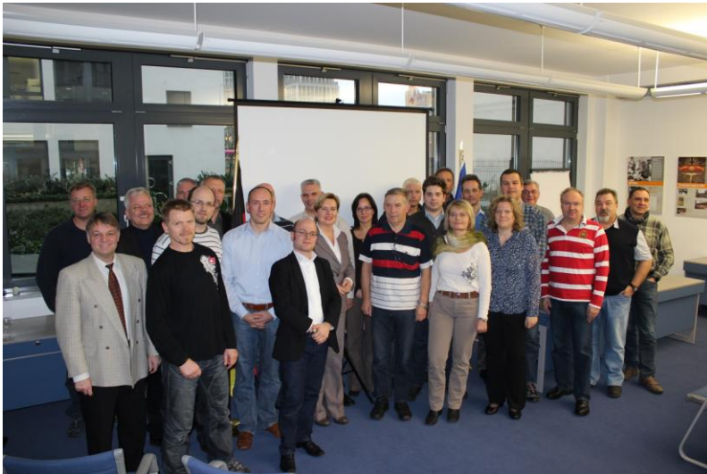
Frau Dr. Eva Högl, MdB, und Berliner Polizisten zu Besuch im EIZ.