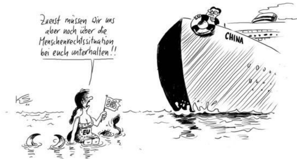
Karikatur aus dem Tagesspiegel vom 14.09.2011

Die Volksrepublik China schreitet als Retter in der Not ein, garantiert die benötigten Milliarden und führt die Euroländer aus der Krise. Dieses Szenario wirft viele Fragen auf. Ein Europa von China finanziert – wären wir damit auf den Weg zu einem Europe Made in China, das sich von der Volksrepublik abhängig gemacht hat? Klar ist, dass China versucht, seine eigenen Interessen zu sichern. Die EU war im Jahr 2010 mit einer Abnahme von 282 Milliarden Euro schließlich der wichtigste Handelspartner. Und China könnte es sich finanziell durchaus leisten, dem Euromarkt eine umfangreiche Finanzspritze zu geben. Schon jetzt gewährt es griechischen Reedern, die einen Großteil der Welthandelsflotte ausmachen und Schiffe in China bauen lassen, einen Kredit in Milliardenhöhe.